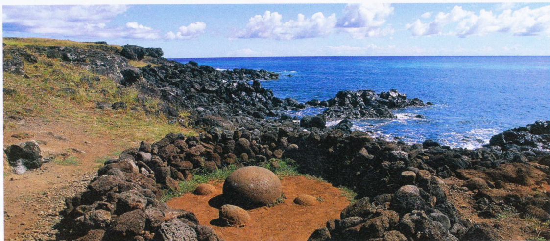
Валуны-магниты: вблизи них не работают телефоны и фотокамеры

мало фолк-шоу в разных частях света, и в основном они производят впечатлительные хорошо отрепетированной подделки под аутентичность. Но в итоге я согласилась пойти и была потрясена увиденным.