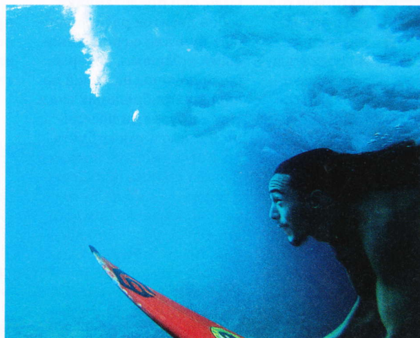
Серферы облюбовали остров Пасхи и живут здесь месяцами

тывали до берега по бревнам. Позднее были попытки повторить этот путь, но ничего не вышло: хрупкий туф крошился, и до берега статуя докатывалась уже без половины лица. А у стоящих на берегу статуй прекрасно сохранились рты и носы, вряд ли они подвергались такой транспортировке. Одна из версий, что истуканы сами шагали к берегу.