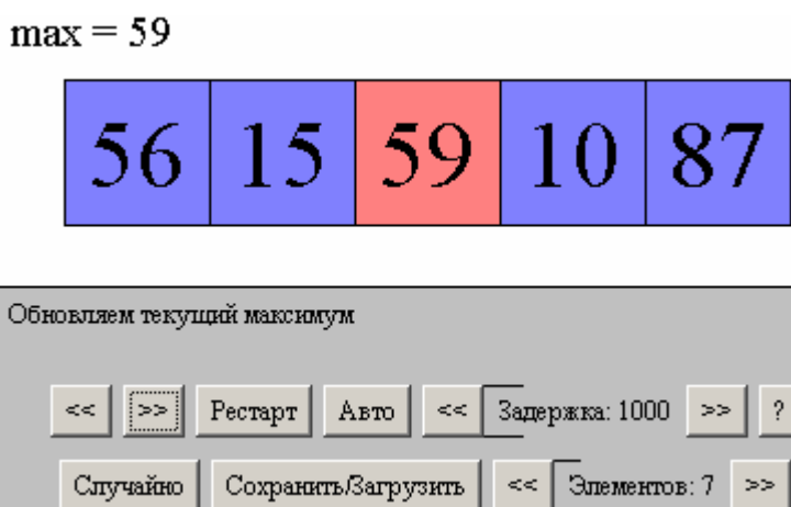
Рис. 3. Визуализатор в одном из состояний

На рис. 3 приведен скриншот построенного визуализатора, запущенного на массиве значений 56 15 59 10 87.