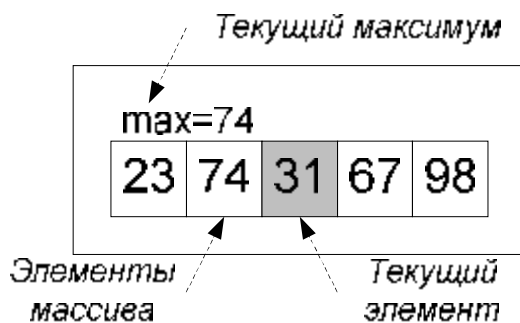
Рис. 1. Схема визуального представления

Разработка концепции визуального представления. Основными данными в визуализаторе являются элементы массива и значение текущего максимума. Их значения постоянно должны быть представлены на экране. Поэтому для визуального представления будем использовать схему визуального представления, изображенную на рис. 1.