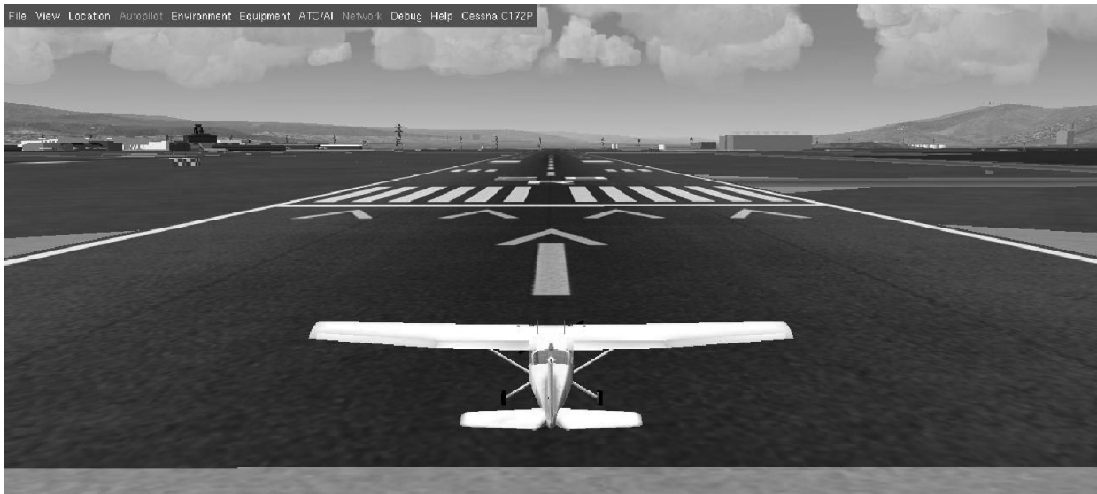
Рис. 2. Снимок экрана симулятора FlightGear в момент начала разгона

Взаимодействие сгенерированного автомата с моделью беспилотного самолета. Существуют симуляторы, моделирующие полет самолета. Авторами был выбран свободный кроссплатформенный симулятор FlightGear ( http://www.flightgear.org ), который применительно к настоящей работе позволяет осуществлять как ручное, так и автоматное управление моделью самолета. На рис. 2 представлен снимок экрана симулятора FlightGear в момент начала разгона.