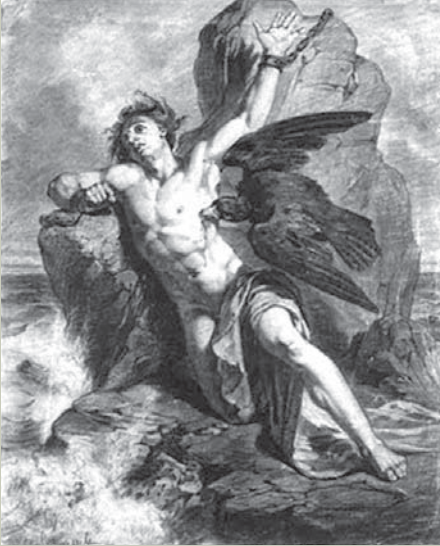
К.Шусселе. Прометей прикованный

этом смысле цепочка «миф – наука – вторичное мифотворчество – новые научные знания» вечна, пока живо человечество.