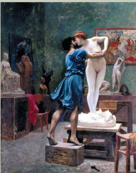
Ж.Л. Жером. Пигмалион и Галатhea

– Мне повезло с моими учителями, и, в частности, учителями литературы. Особенно в моей родной 30-й школе. Нас учили думать, думать и сомневаться – в том числе и на истории, и на литературе. Не угадывать, что хочет услышать преподаватель, а думать, спорить, отстаивать с фактами и текстами в руках свою точку зрения. И доказывать не её единствен-