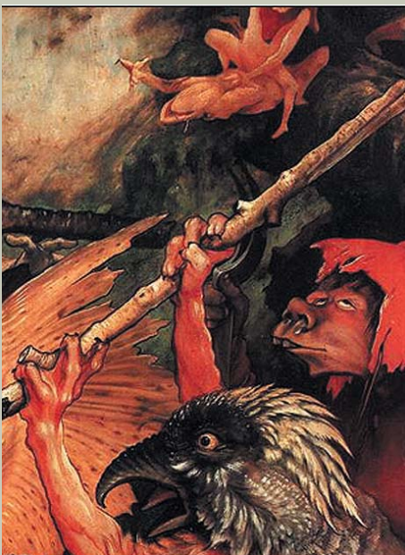
Фрагменты Изенгеймского алтаря (автор – М.Грюневальд. 1506–1515 гг.) со сценой искушения святого Антония. В средние века эта створка алтаря демонстрировалась верующим всего один раз в году, по случаю праздника святого Антония.